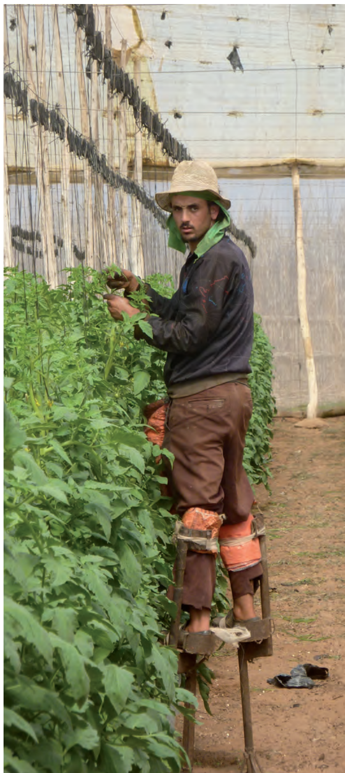
Travailleur agricole dans une serre maraîchère au Maroc.

La Confédération paysanne revendique ainsi une aide aux petites fermes du seul fait qu'elles existent (maillage social, territorial, ...) et que celle-ci soit plus élevée que les 500 euros proposés, qui constituent, à notre sens, plutôt une aide à la cessation. Il faut insister sur le principe de souveraineté alimentaire qui englobe tout un tas d'enjeu : le droit de protéger sa production vivrière et de vendre localement, le droit de protéger les travailleurs et les paysans, le droit d'accès à la terre. Notre métier n'est pas d'assassiner les paysans des autres pays !